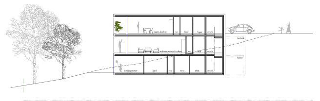
schnitt s1 - s1