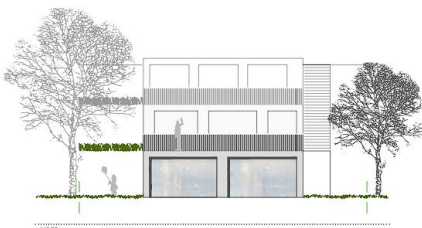
ansicht ost haus a