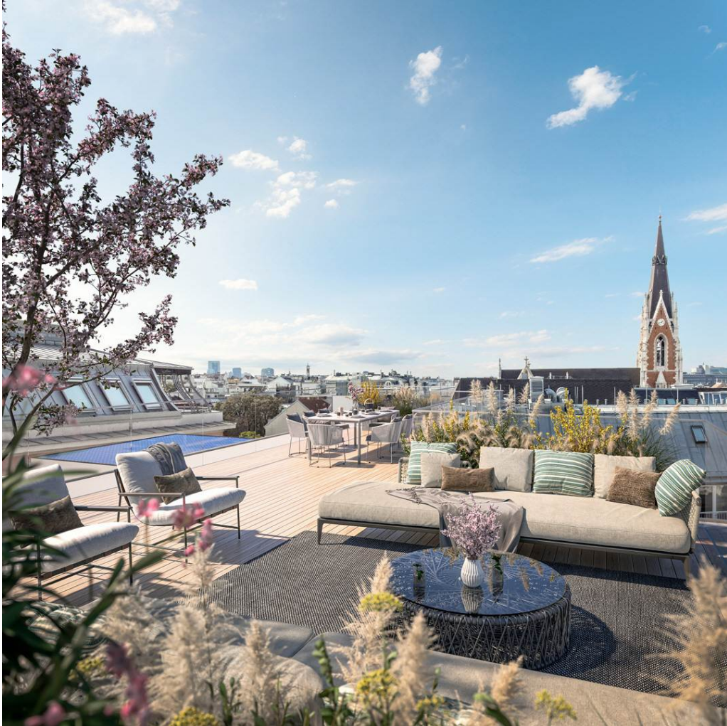
Terrasse + Aussicht