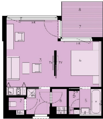
TOP 27 CA. 58,27 M 2