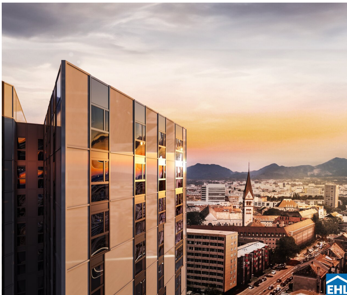
High Five Visualisierung