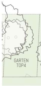
TOP4 Übersichtsplan Garten