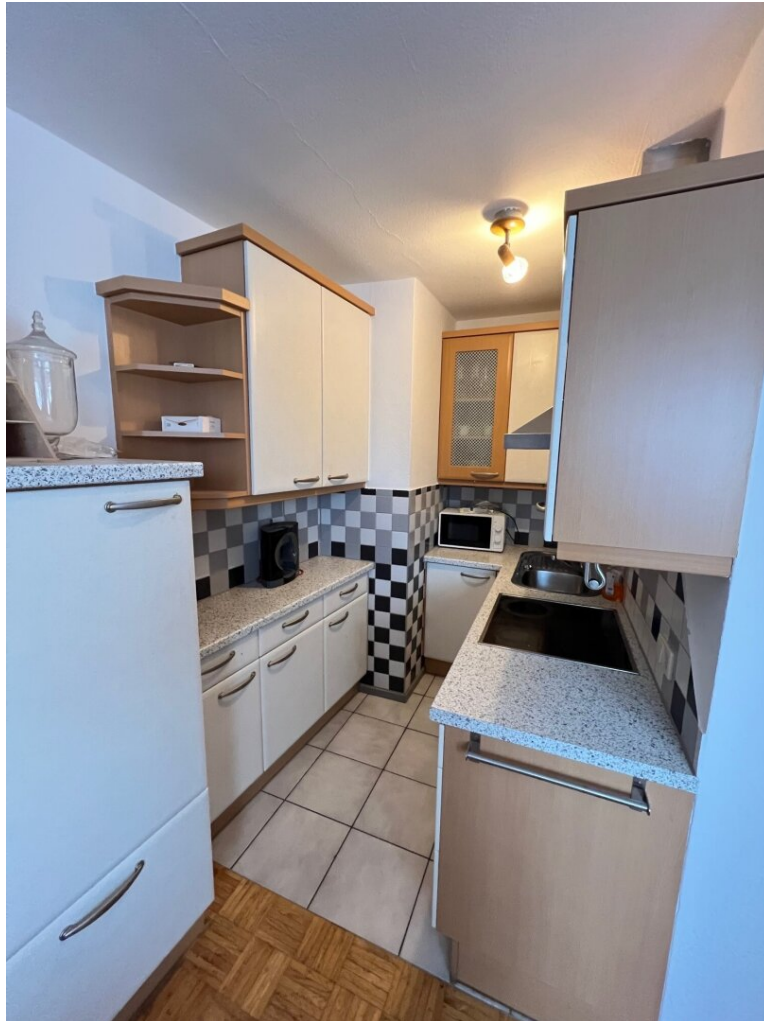
eingeriectete Küche mit Küchenblock