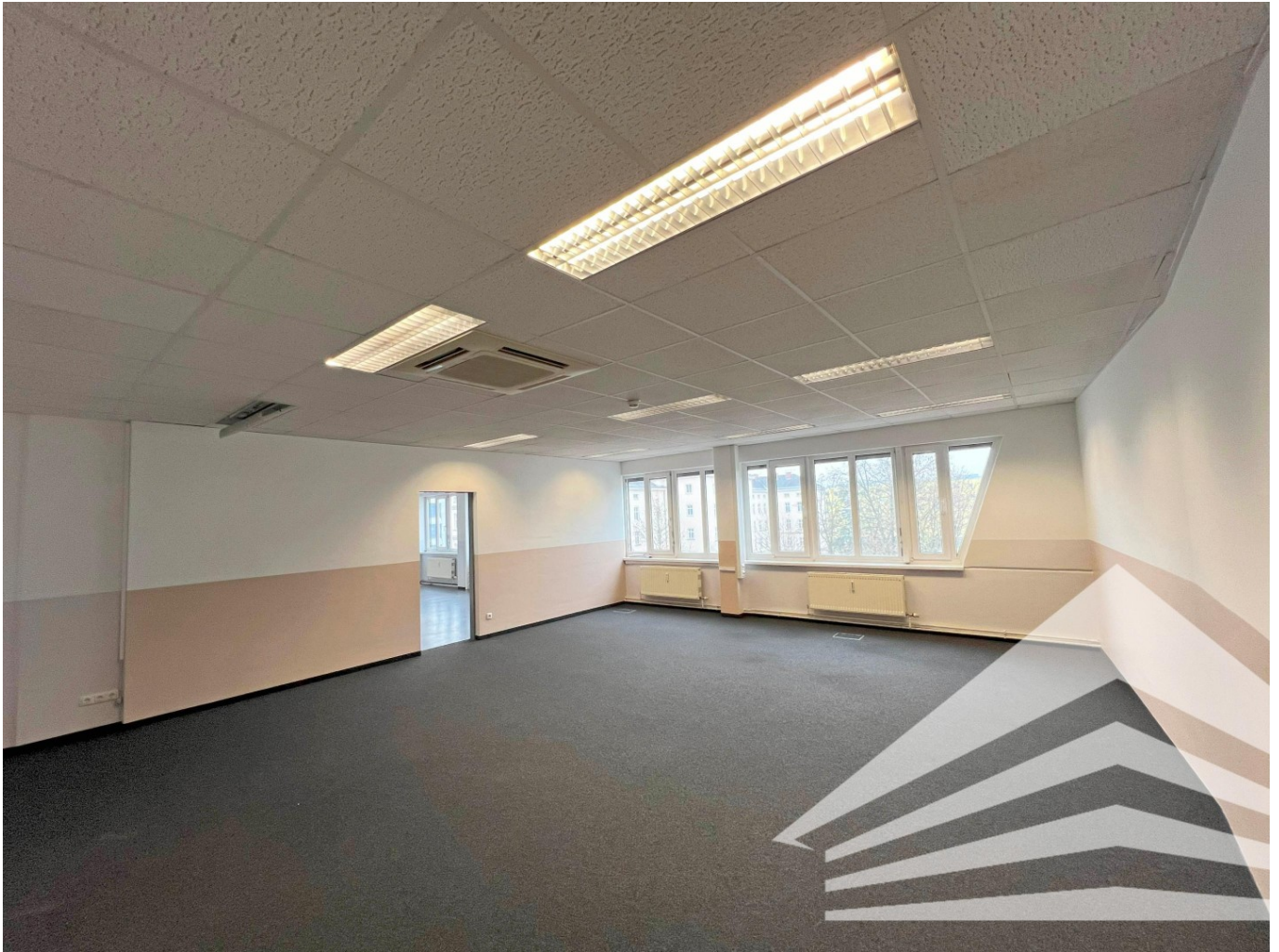
Seminarraum / Großraumbüro