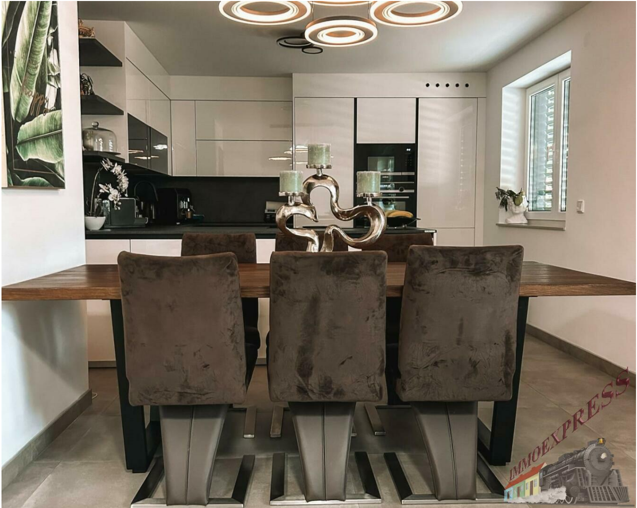
Essbereich mit Küche