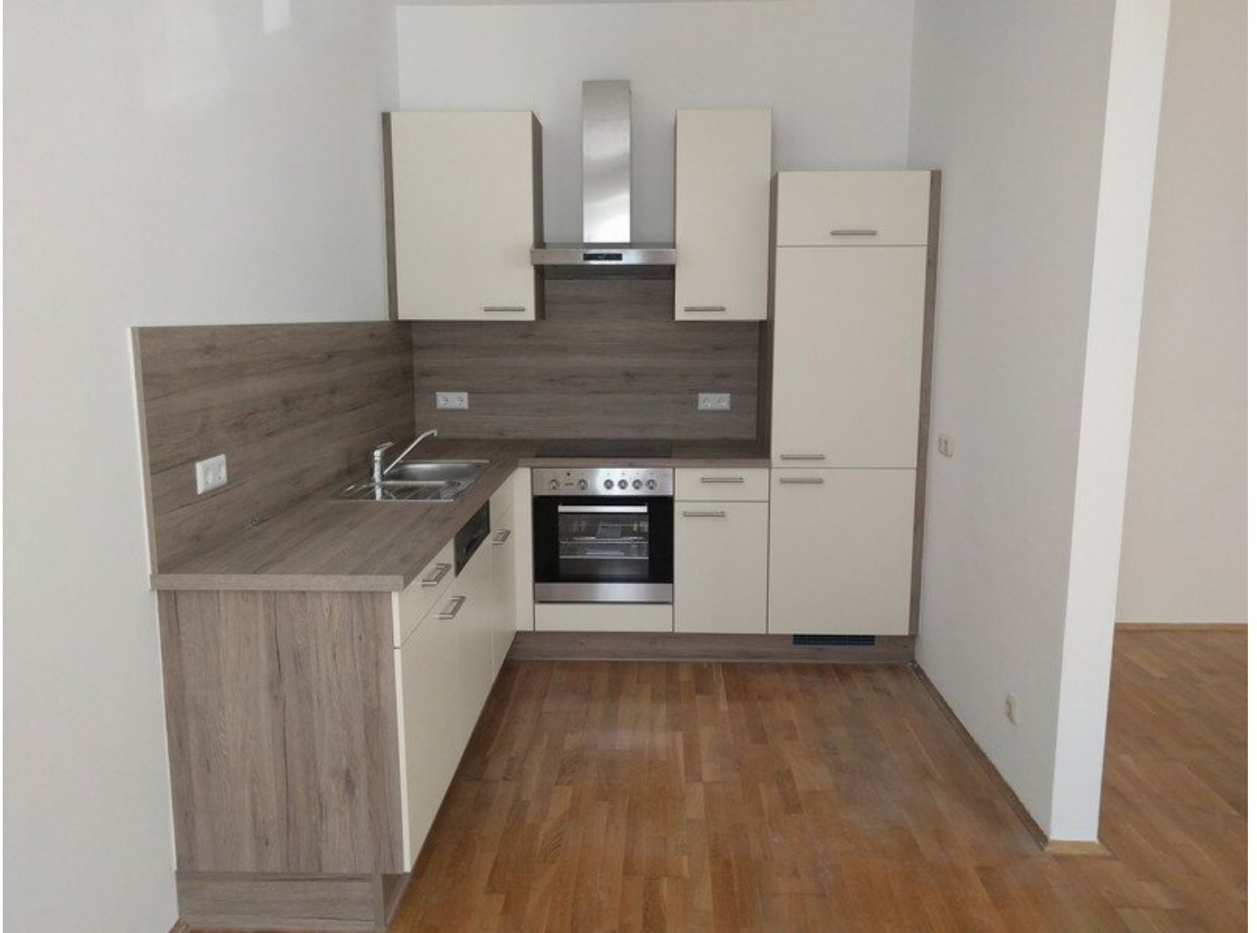
1 Küche Leitnergasse