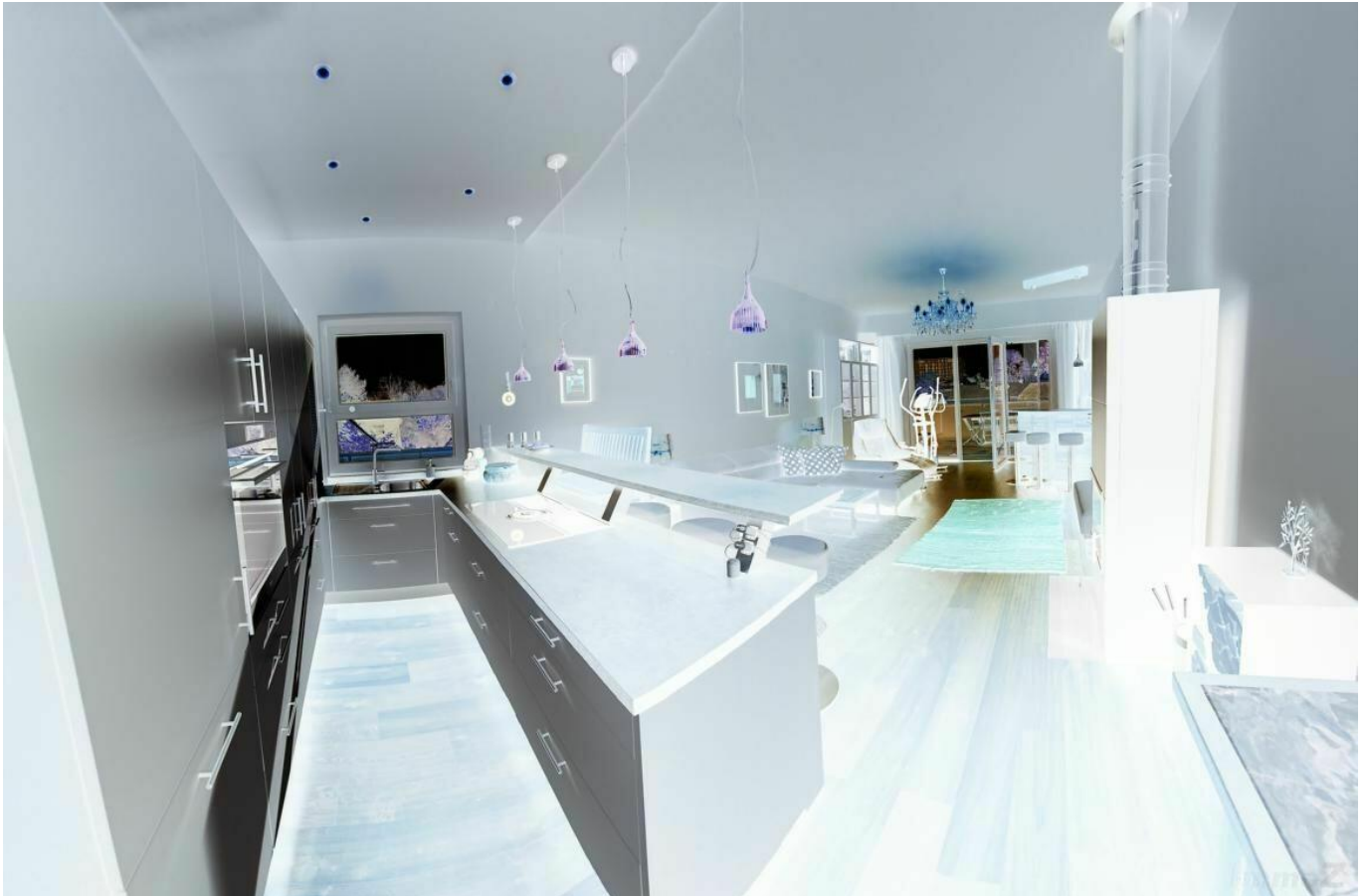
Wohn-Essbereich mit Küche

**Luxus-Penthouse Nähe ORF-Park** Atemberaubende Sonnenuntergänge**technische Raffinessen**3 Carportabstellplätze**zusätzliche 40m 2 im UG als Fitnessraum** u.v.m.