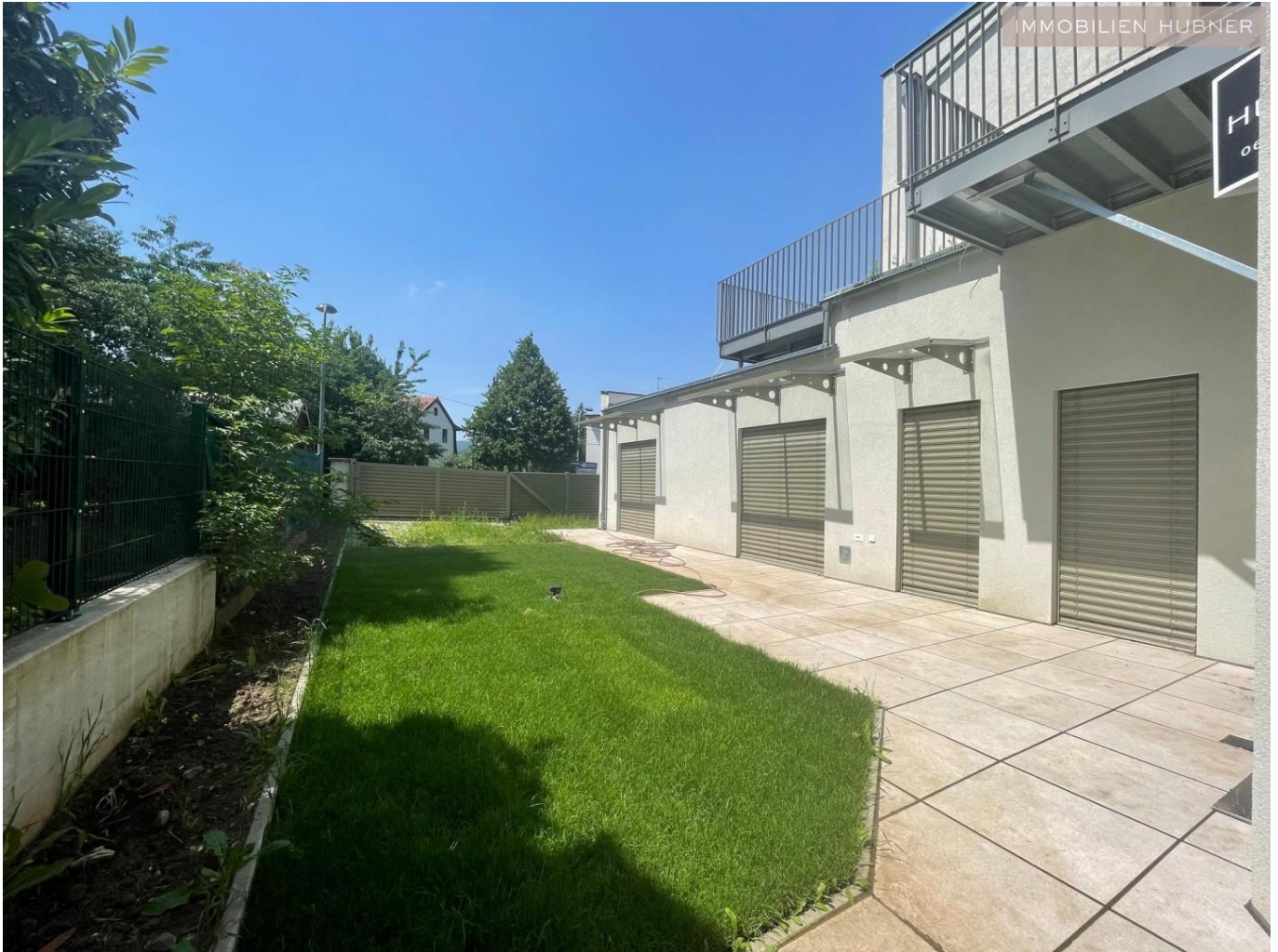
Garten und Terrasse