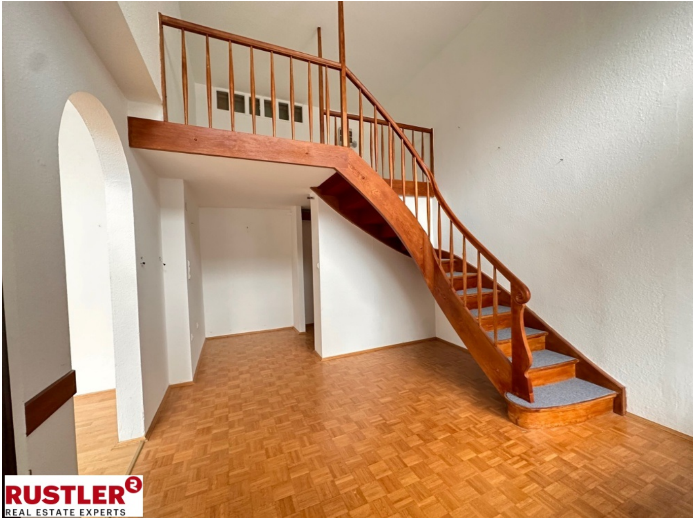
Ansicht Galerie 1