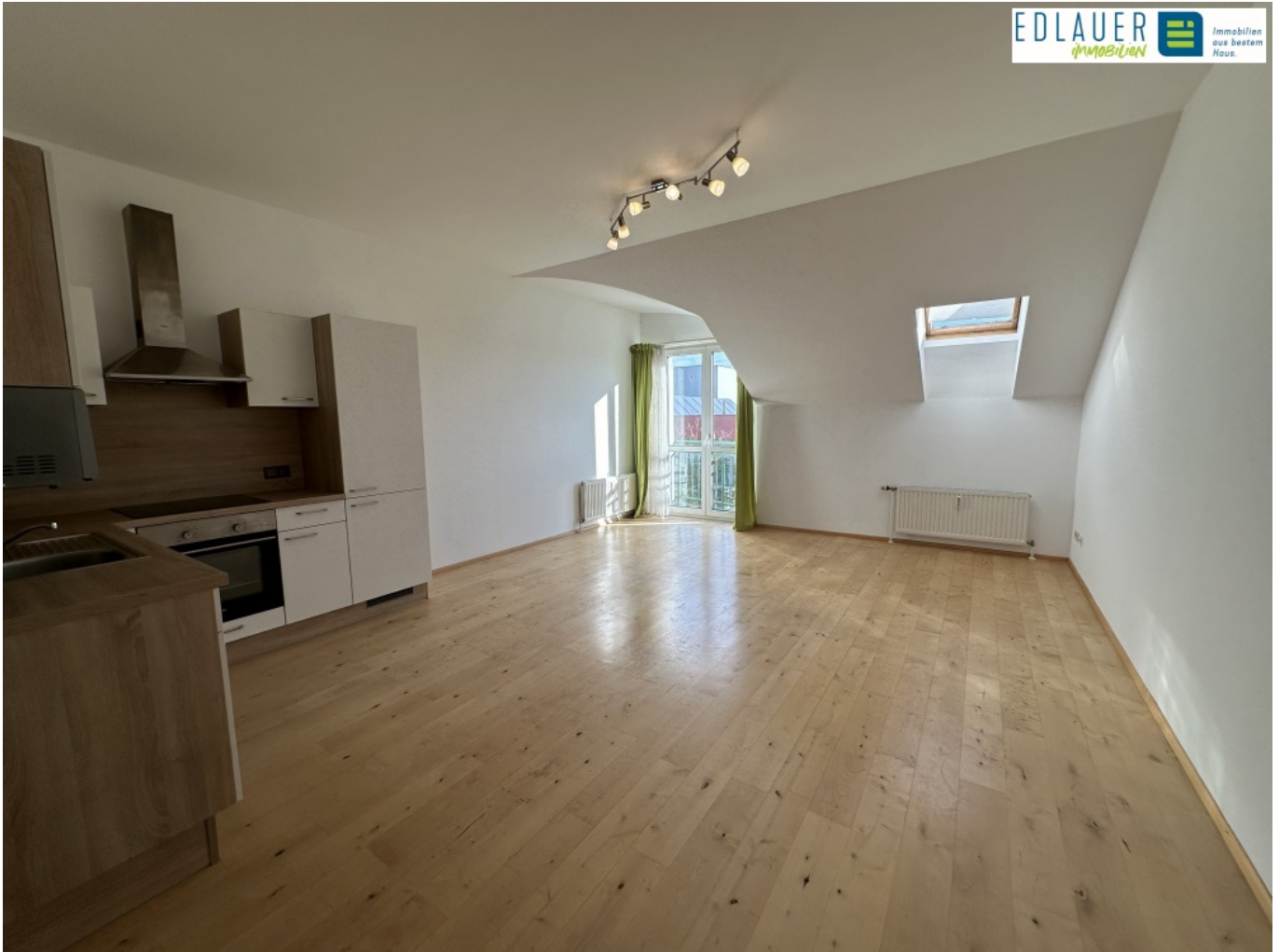
Raum 1 (1)