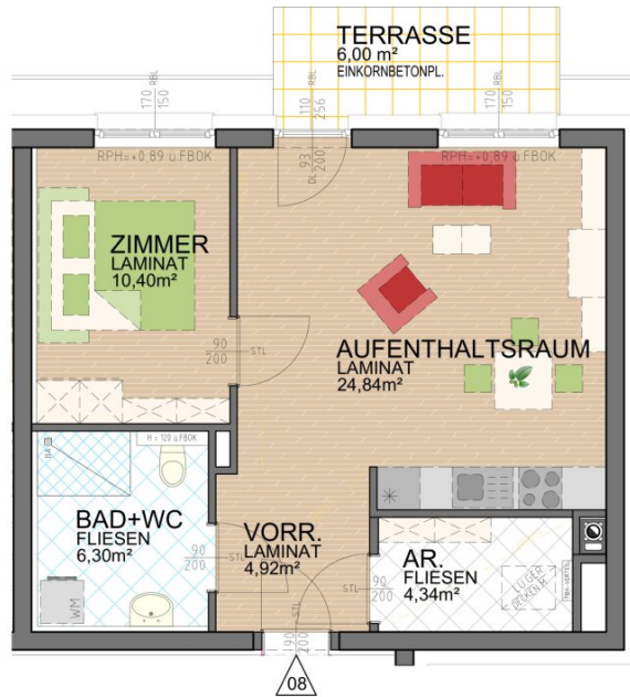
ÜBERSICHTSPLAN I. OG

WOHNUNG 8 2 ZIMMER WNFL 50,80m 2 I.OBERGESCHOSS