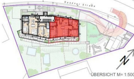
ÜBERSICHT M= 1:500