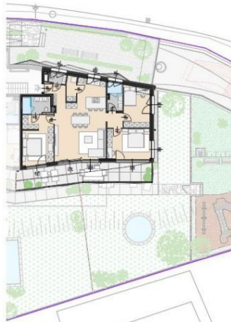
GRUNDRISS M= 1:250