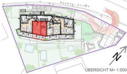
ÜBERSICHT M= 1:500