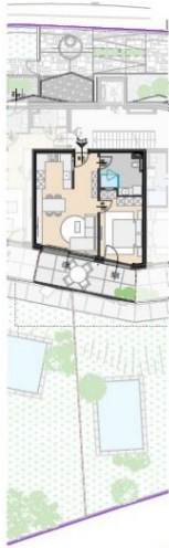
GRUNDRISS M= 1:250