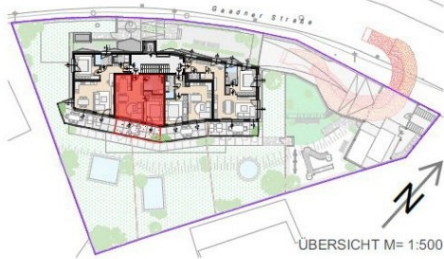
ÜBERSICHT M= 1:500