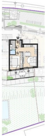
GRUNDRISS M= 1:250