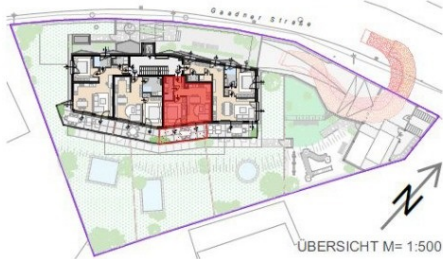
ÜBERSICHT M= 1:500