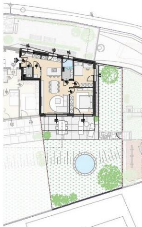
GRUNDRISS M= 1:250