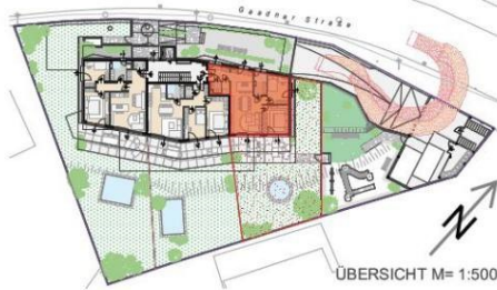
ÜBERSICHT M= 1:500