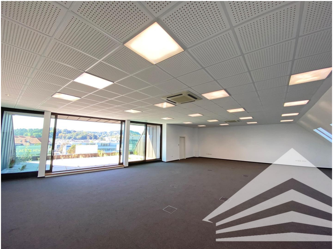
Seminarraum 6. OG mit Dachterrasse