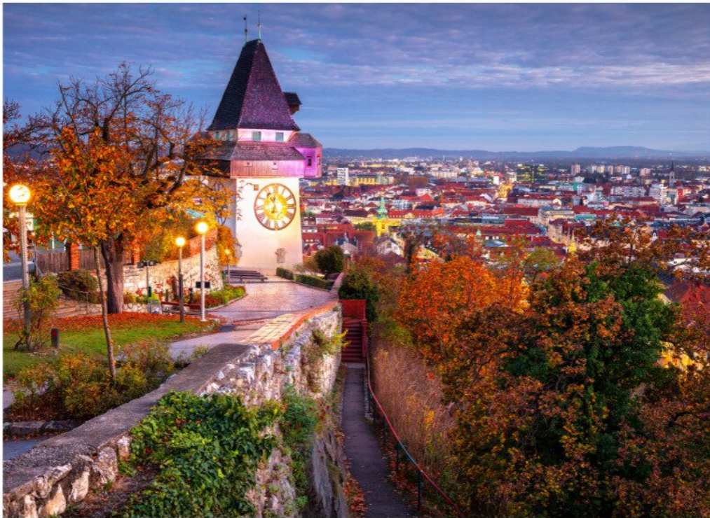
Graz im Herbst