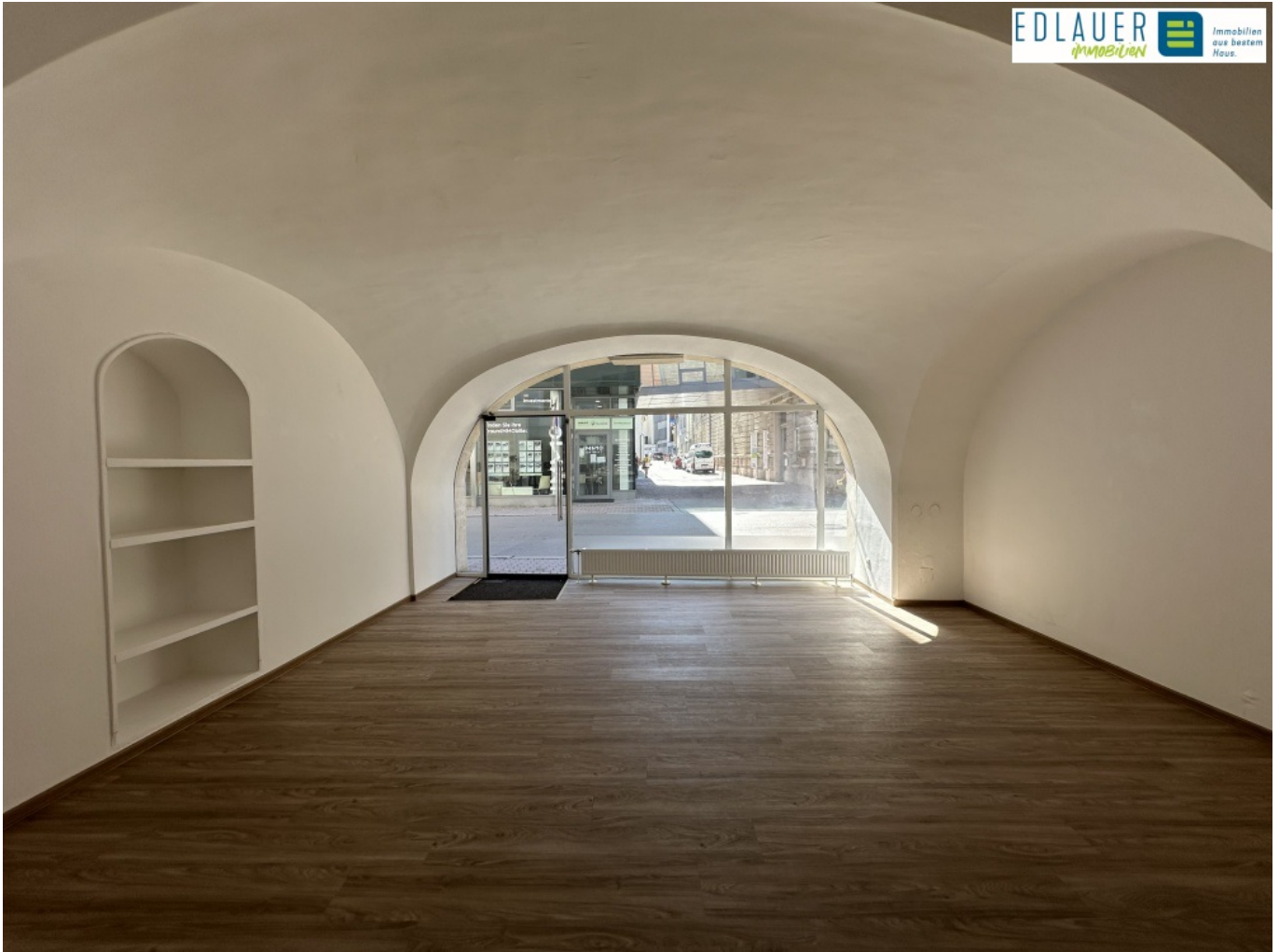
EG Verkaufsraum (2)