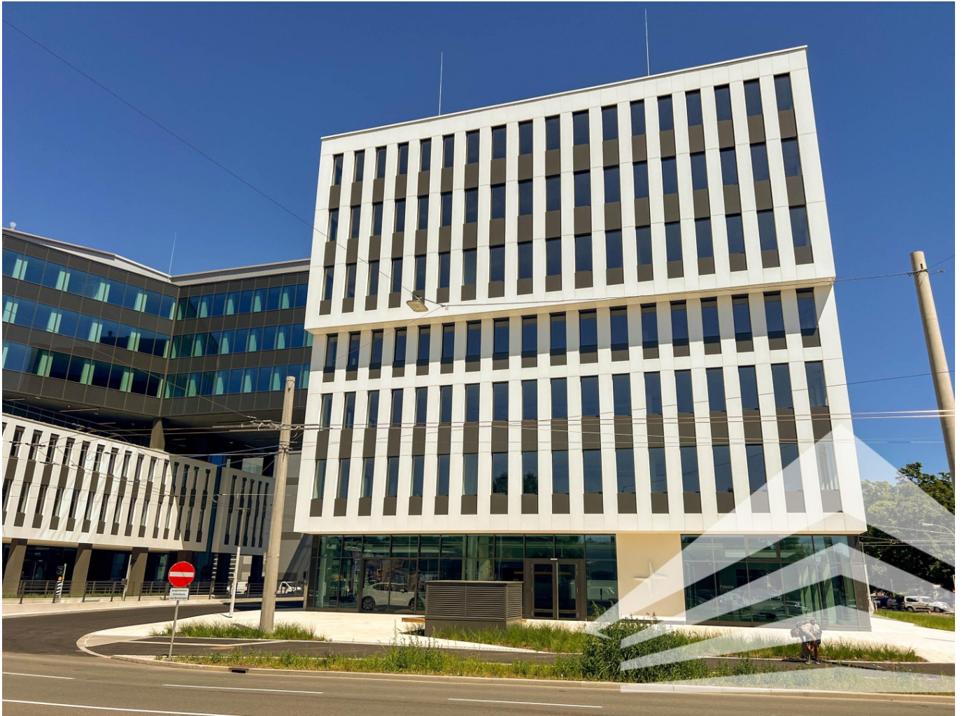
Ansicht Bauteil C Hafenportal