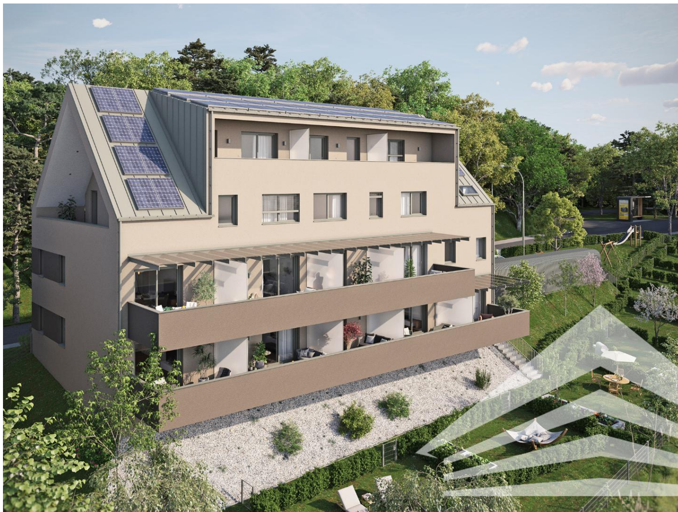
Rendering Innenansicht Muster