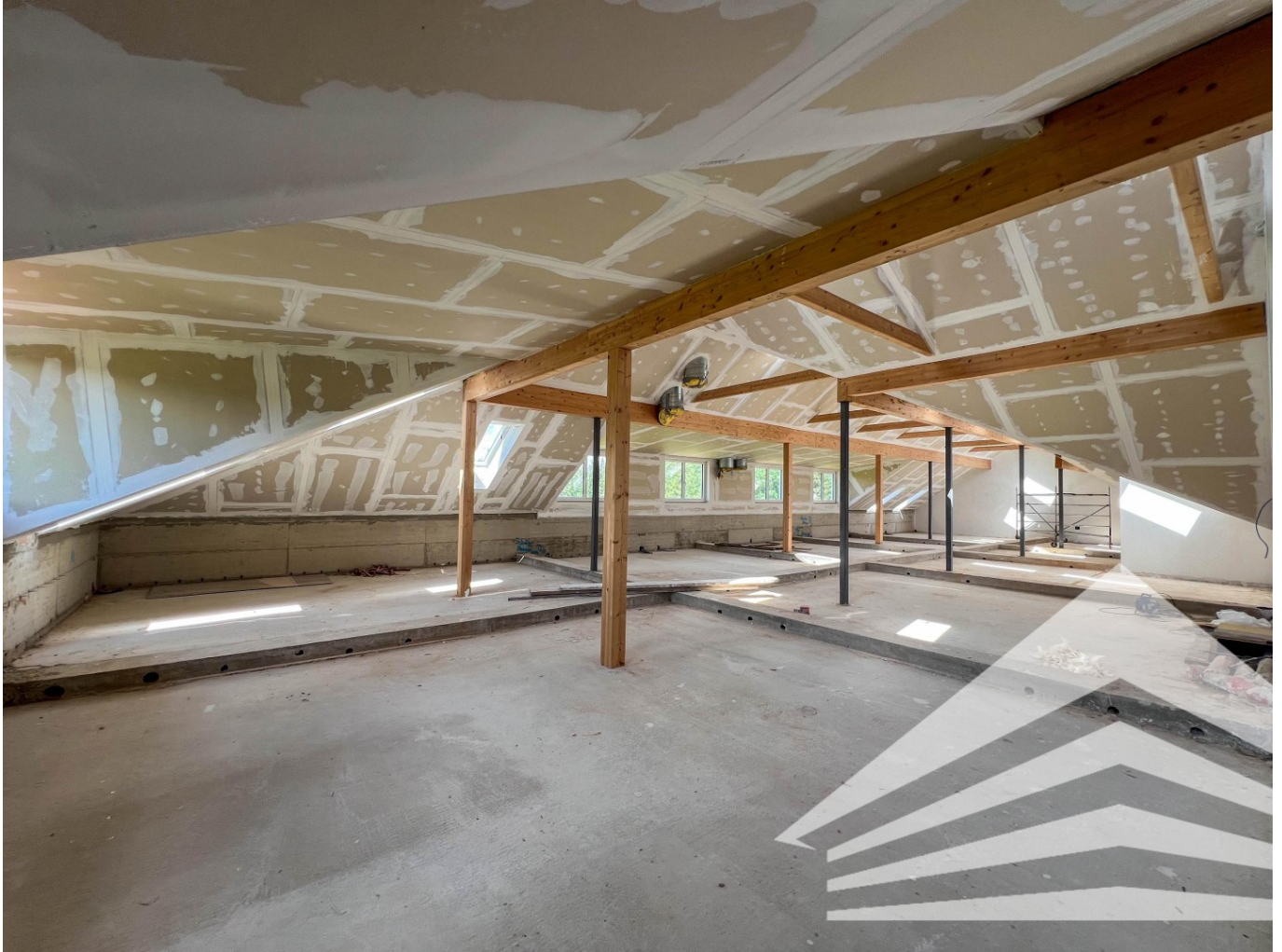
DG Bürofläche roh