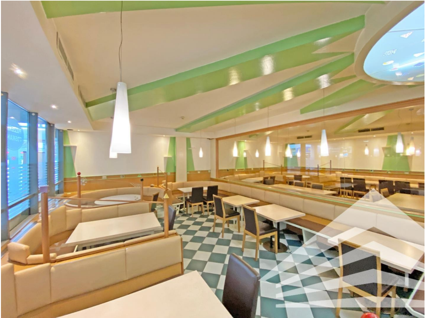
Ansicht Gastraum 1