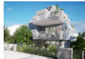
WOHNHAUSANLAGE Gotthelfgasse 6, 1220 Wien

Julius-Payer-Gasse 7, 1220 Wien +43 (1) 263 27 74, +43 (0) 664 161 94 29