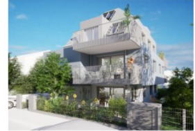
WOHNHAUSANLAGE Gotthelfgasse 6, 1220 Wien

Julius-Payer-Gasse 7, 1220 Wien +43 (1) 263 27 74, +43 (0) 664 161 94 29