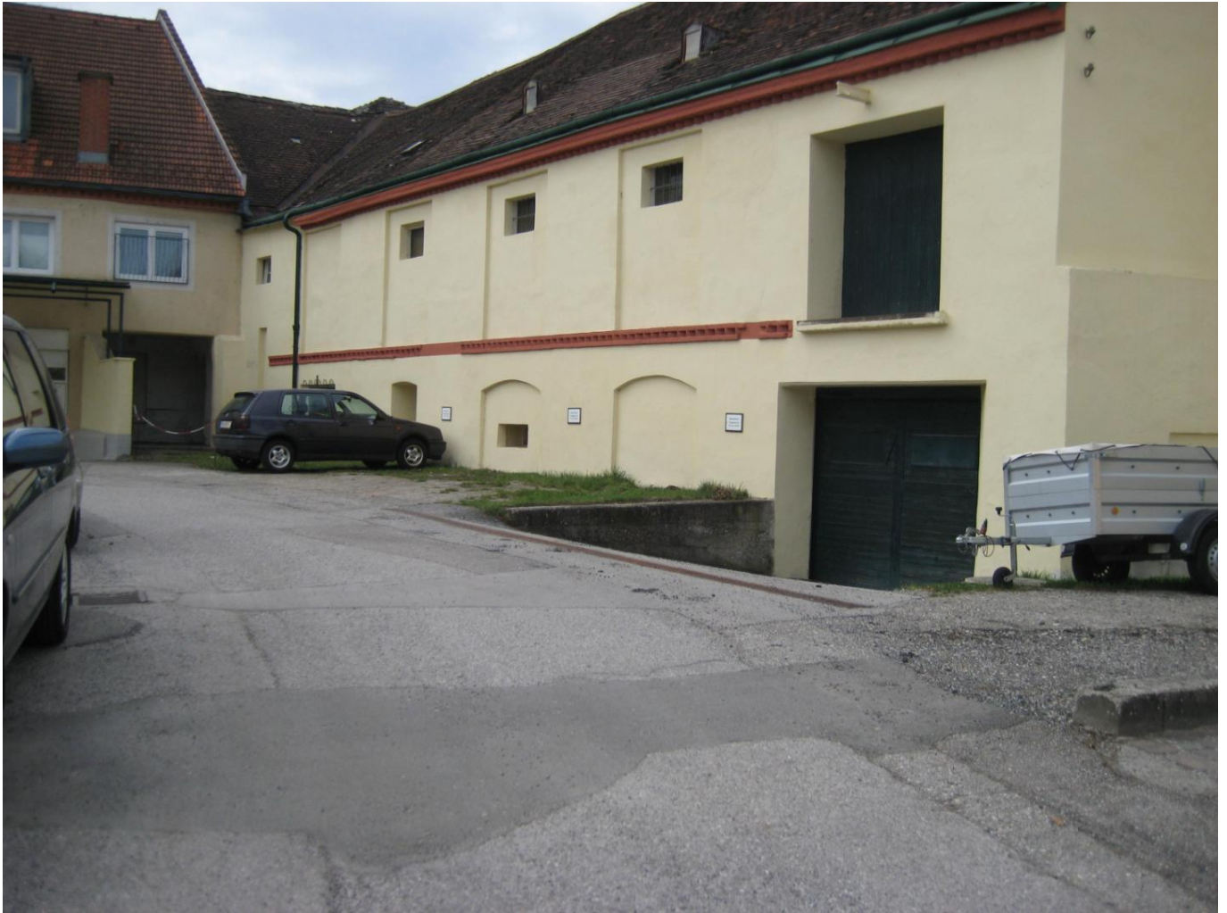
Brauhausgasse in Melk West

Objektnummer: 3817_50 Eine Immobilie von Immobilien-Melk