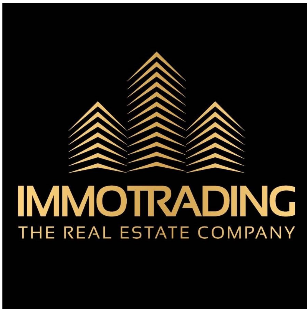
Logo IT gold quadrat

Langfristig vermietete Tankstelle direkt an der Autobahn in guter Lage Österreichs