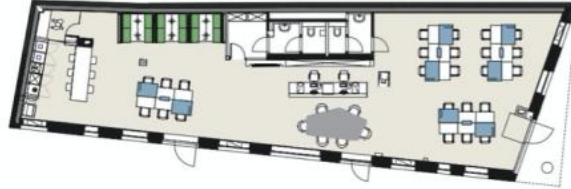
GROUND LEVEL FLOOR PLAN (EXISTING)