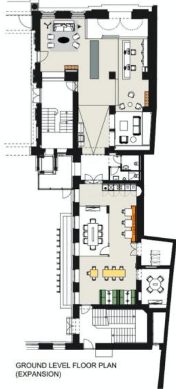
GROUND LEVEL FLOOR PLAN (EXPANSION)