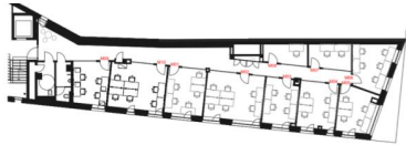
MEZZANINE LEVEL FLOOR PLAN (EXISTING)