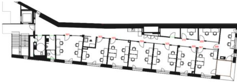
3RD LEVEL FLOOR PLAN (EXISTING)