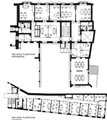
2ND LEVEL FLOOR PLAN (EXPANSION)