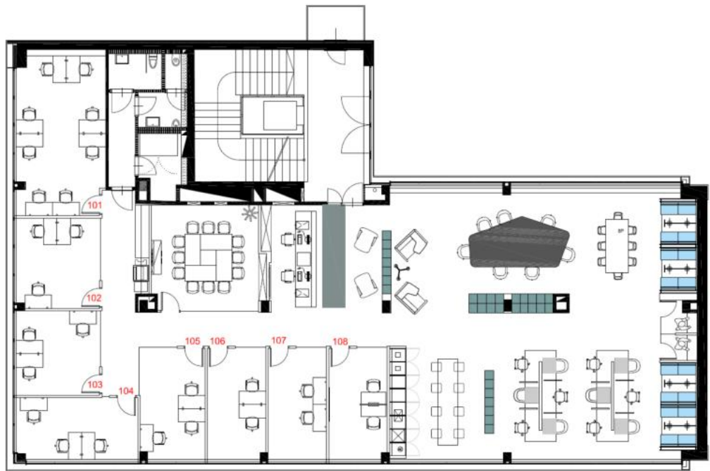
1ST LEVEL FLOOR PLAN