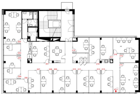
2ND LEVEL FLOOR PLAN