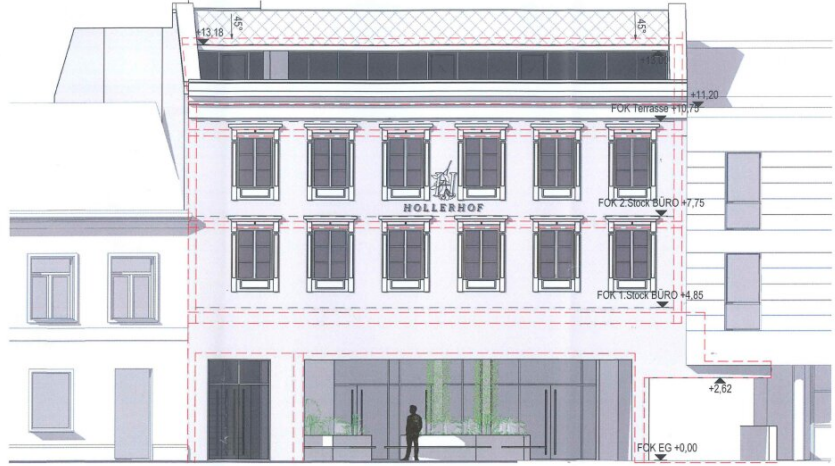
OSTANSICHT Bereich E M 1:100

FAWE Immo GmbH 2070 Retz | Hauptplatz 15 Hauptplatz 4, 2020 Hollabrunn OSTANSICHT Bereich E 1:100