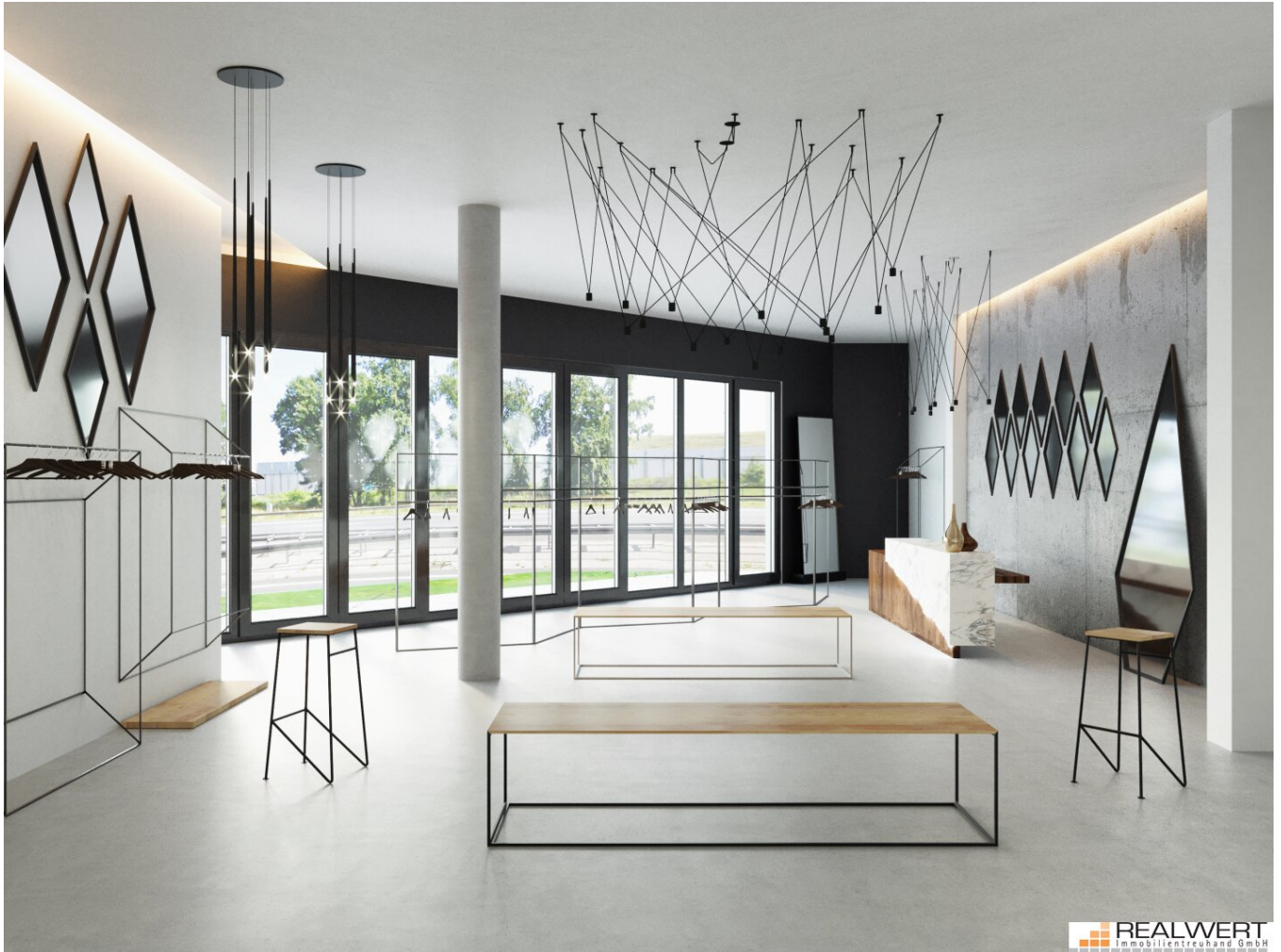
point PUCH Showroom - Retail EG