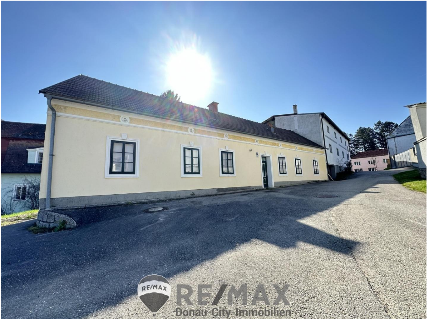
01 Einfamilienhaus in Hausleiten