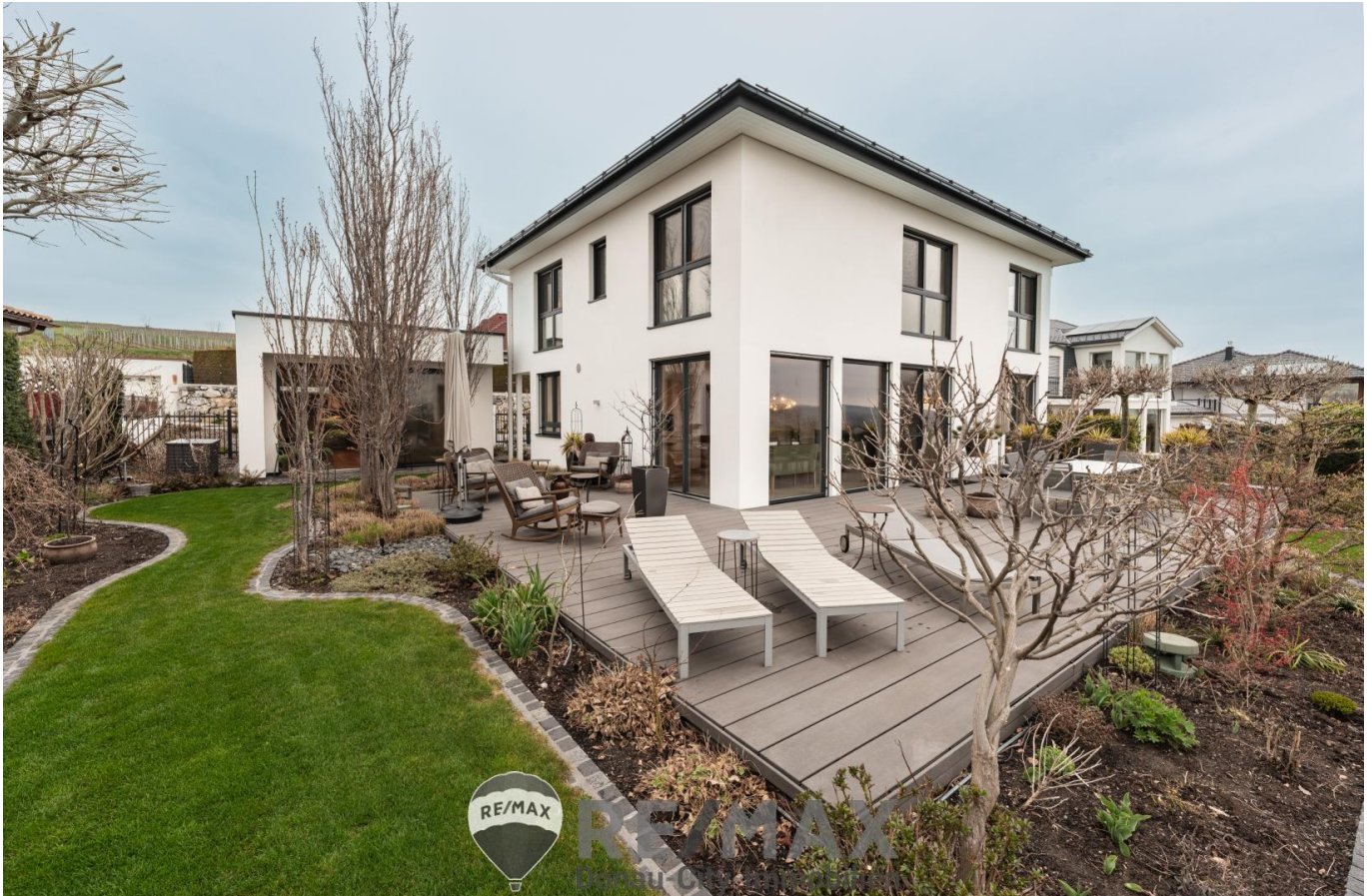
1 Außenansicht | Terrasse