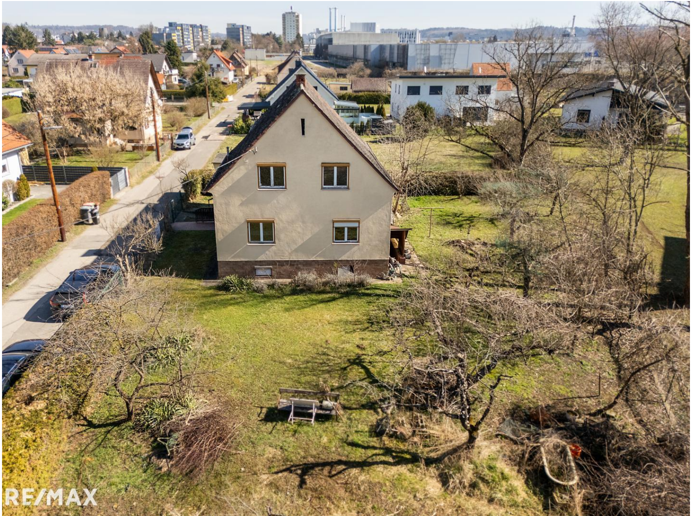
Drohne Hinteransicht Haus