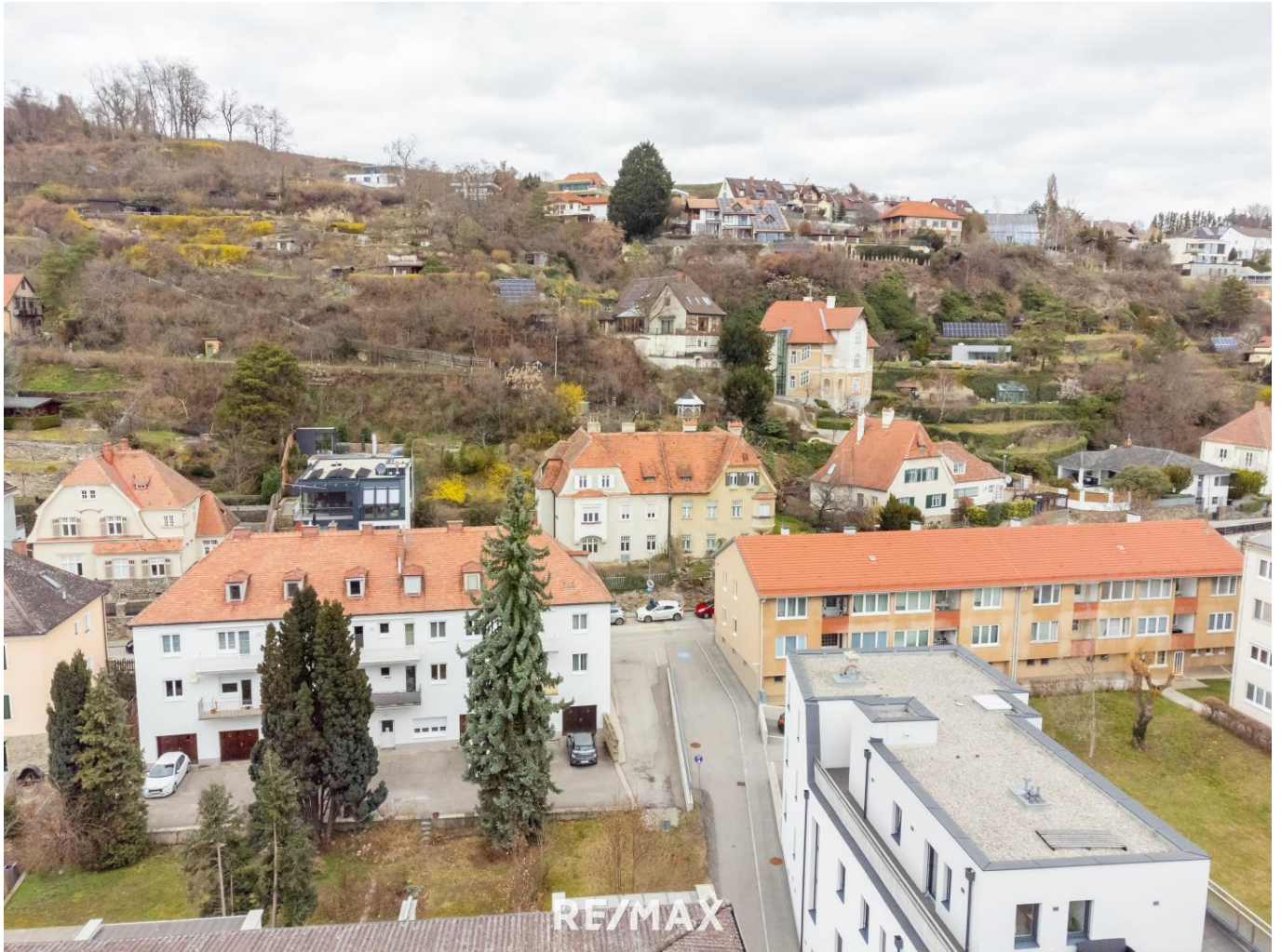
Blick in die Hügel von Krems