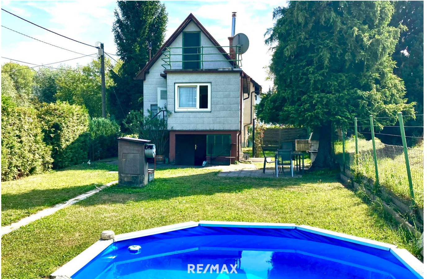
Garten mit Pool