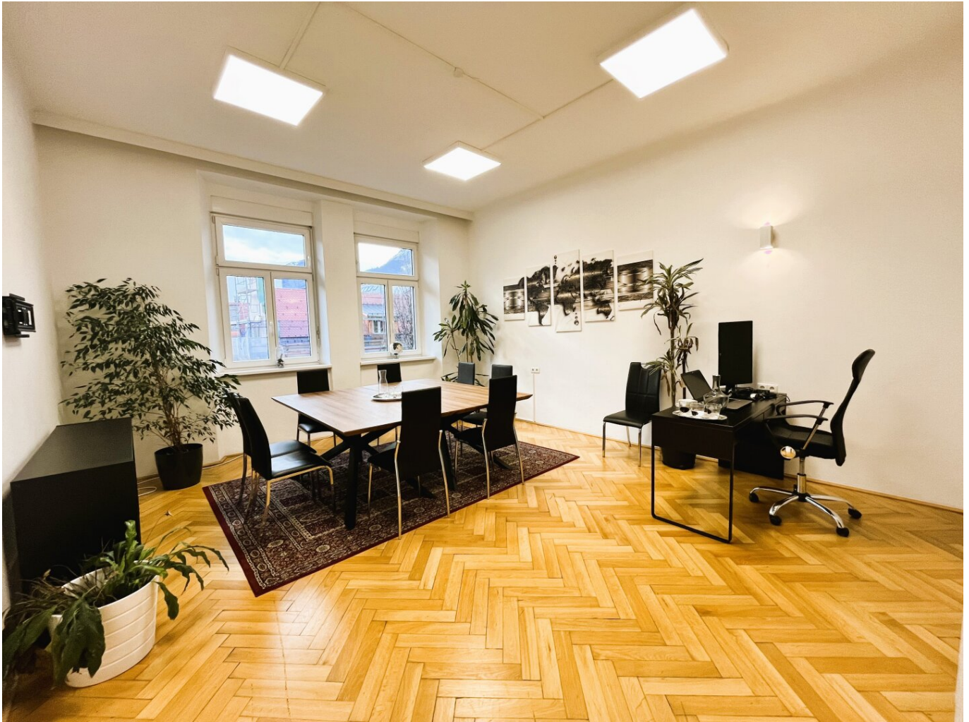
Raum C mit ca. 25m 2