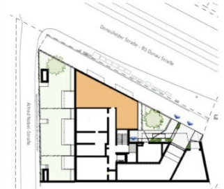
ORIENTIERUNGSPLAN | +0 ERDGESCHOSS

2025.03.11 | D02 WOHNUNGSPLAN | DS104_A00_PP_X