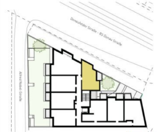
ORIENTIERUNGSPLAN | +1 OBERGESCHOSS

2025.03.11 | D02 WOHNUNGSPLAN | DS104_A00_PP_X