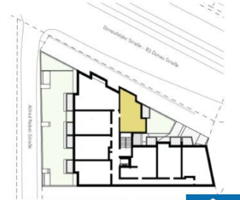
ORIENTIERUNGSPLAN | +2 OBERGESCH

2025.03.11 | D02 WOHNUNGSPLAN | DS104_A00_PP_X