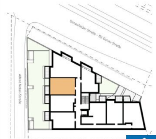
ORIENTIERUNGSPLAN | +3 OBERGESCHOSS

2025.03.11 | D02 WOHNUNGSPLAN | DS104_A00_PP_X