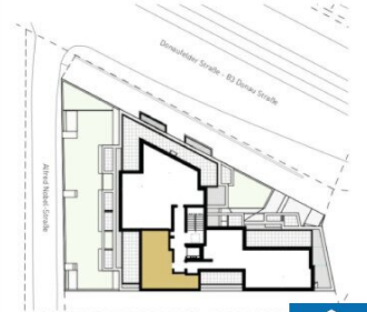
ORIENTIERUNGSPLAN | +4 DACHGESCHOSS

2025.03.11 | D02 WOHNUNGSPLAN | DS104_A00_PP_X