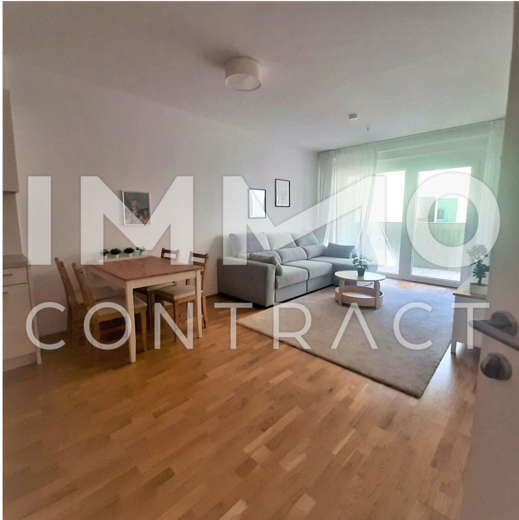
Casa Oberlaa Wohnzimmer

Wundervolle Terrassenwohnung im schönen Oberlaa! Nur am dem 60.Lebensjahr anzumieten! Provisionsfrei