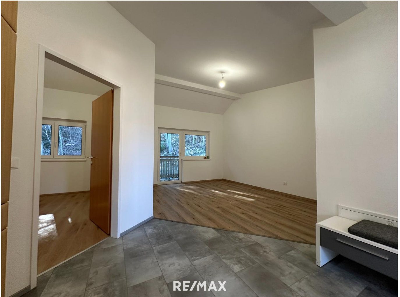
Wohnung - Wohnbereich