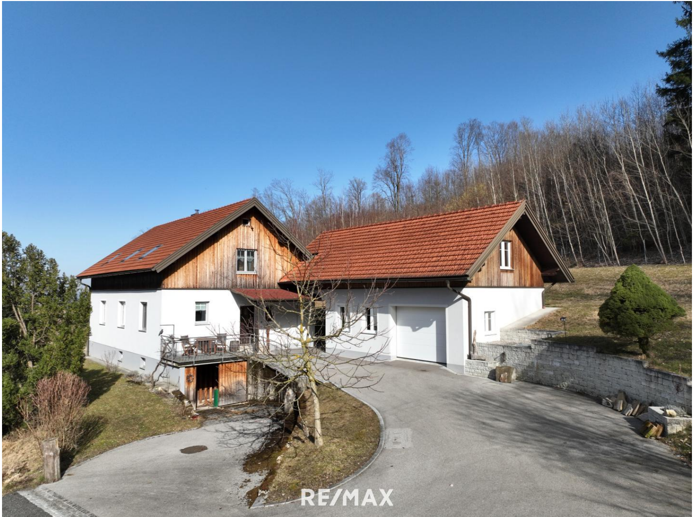
Wohnhaus in Alleinlage mit Panoramablick