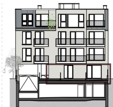
KLUGARGASSE 12 - 1230 WIEN