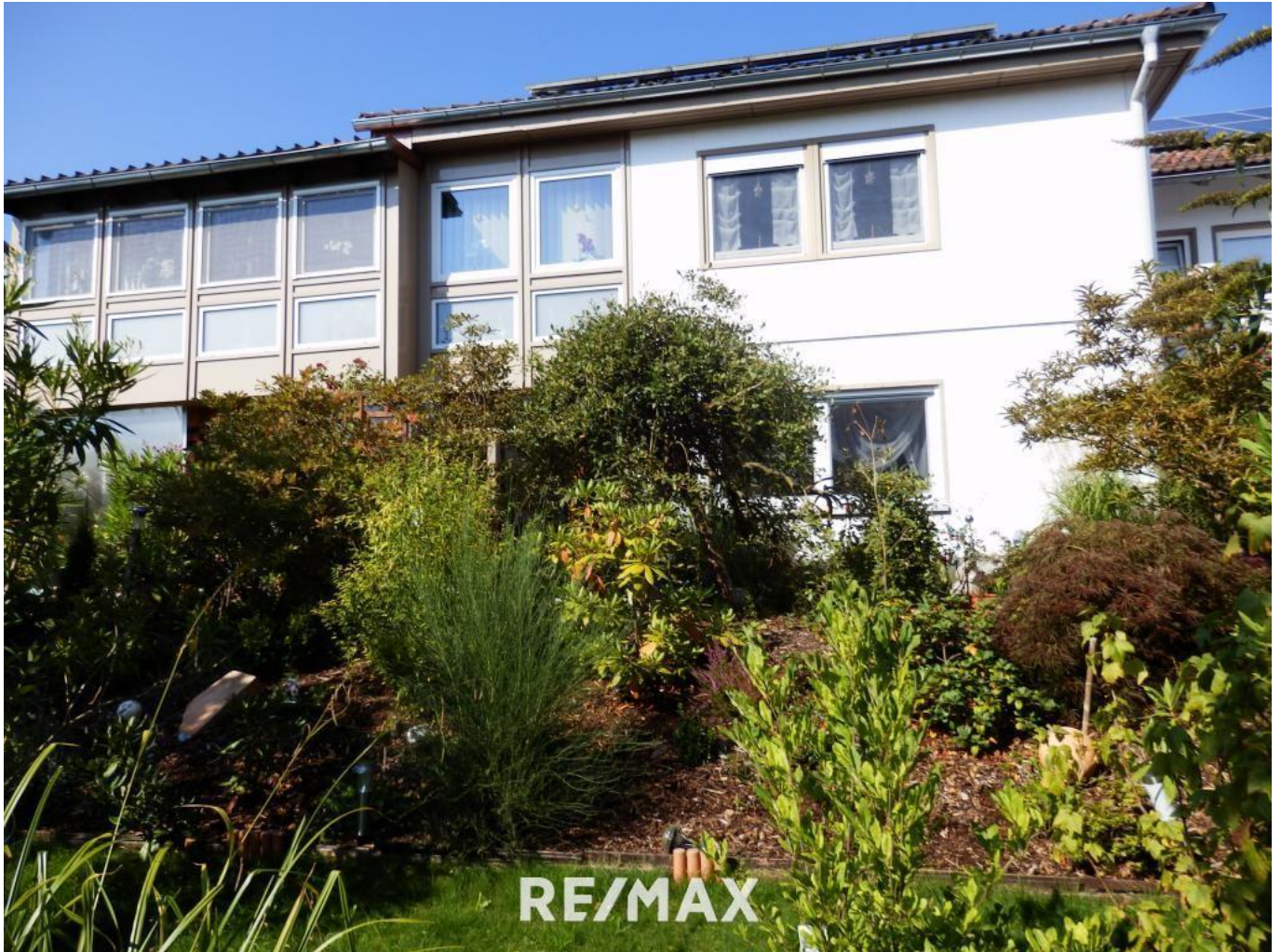
Aussicht vom Garten auf Haus