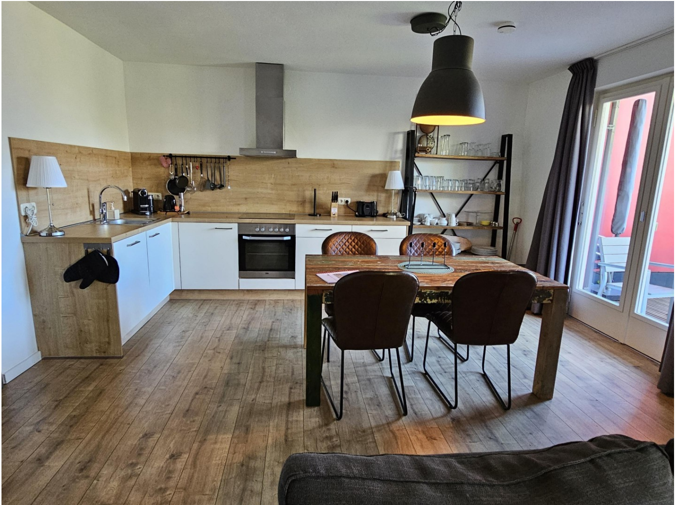
Kochen-Essen-Wohnen Top 4