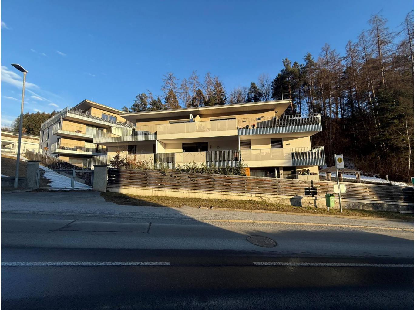
Außenansicht Wohnung Imst